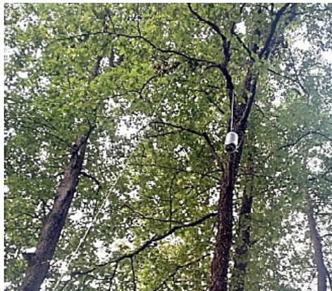
Рис. 1. Внешний вид и рабочее состояние ловушки

красного и белого вина с сахаром. В качестве фиксатора в них был залит спирт. Ловушки были выставлены в разных биотопах (смешанных, лиственных лесах, сосняках, лесополосах, горельниках и др.). Материал выбирался в среднем через 7–15 суток и помещался в спирт. Определение материала выполнено первым автором, сбор – соавторами.